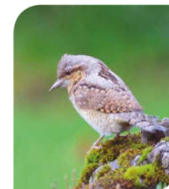
Schafe halten das Gras kurz, wovon der Wendehals bei der Nahrungssuche profitiert