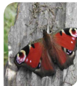
Ein Tagpfauenauge und die Birne „Gräfin von Paris“

Auf einer Streuobstwiese stehen hochstämmige Obstbäume, deren große Kronen bei etwa 1,80 Meter ansetzen. Noch bis Mitte des letzten Jahrhunderts leisteten Streuobstwiesen einen wichtigen Beitrag zur Obstversorgung, oft waren sie fester Bestandteil von landwirtschaftlichen Betrieben. Doch im Zuge des Obstanbaus in Niederstamm-Plantagen wurden sie wirtschaftlich uninteressant und die Bestände gingen stark zurück.