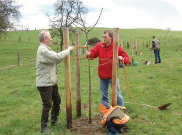
Schon die Kleinsten helfen auf der Streuobstwiese tatkräftig mit