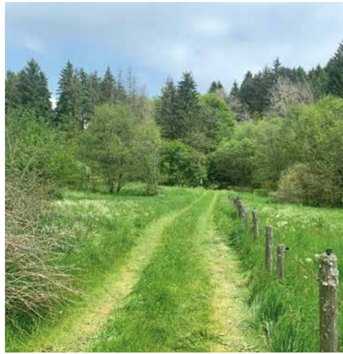
An den Bünnbachteichen

Neben den naturschutzwürdigen Flächen, die durch das Vorkaufsrecht in die Stiftung kommen, werden zunehmend auch aus dem privaten Bereich Flächen gestiftet oder angeboten. Insgesamt sind bald 50 Hektar Land im Eigentum der Stiftung: Im Rhein-Sieg-Kreis konnte eine ehemalige Landwirtschaftsfläche, heute Grünland mit durchfließendem Gewässer, gesichert werden. Zwei Streuobstwiesen bereichern das Eigentum der Stiftung zusätzlich: eine in Herford und eine in Duisburg-Baerl. Einen Teil einer Streuobstwiese deckt auch die Fläche „Bruchhausen“ im Kreis Höxter ab. Im Kreis Lippe konnte eine Fläche mit einem orchideenreichen Wald und einem Halbtrockenrasen für den Naturschutz erhalten werden. Gleich zwei Flächen in der Gemarkung Hellenthal im Kreis Euskirchen kamen dazu: Eine ehemalige Fischzuchtanlage, heute eine Fläche für Amphibien und eine Wald- und Grünfläche mit Bachlauf (Bünnbach). Außerdem eine Orchideenwiese (Weiler am Berge). Die Aktiven des NABU Euskirchen e.V. setzen auf Ihren Flächen auf eine enge Zusammenarbeit mit der Biologischen Station. Durch EU-Förderprojekte können auch kostenintensive Maßnahmen, wie die Rückführung eines Bachlaufs in sein ursprüngliches Bett, umgesetzt werden. Zwei weitere Flächen nahm die Stiftung in Wegberg Merbeck auf. Die Waldflächen sollen sich naturnah entwickeln dürfen. Der NABU Oberberg e.V. pflegt nun die neu in die Stiftung eingegangene Waldfläche in Radevormwald.