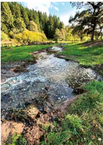
Bachaue in Euskirchen

Nach anfänglichen Schwierigkeiten zwischen Behörden, Notaren und Stiftung sind viele Herausforderungen mittlerweile gemeistert. Seit Inkrafttreten des Gesetzes sind rund 300 Angebote eingegangen und 11 Flächen in ganz NRW sind ins Eigentum der Stiftung und die Betreuung der NABU-Gruppe vor Ort übernommen worden wie Grünland in Euskirchen und Höxter oder Waldflächen in Wegberg und Lippe.