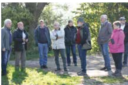
Menschen vor Schautafel