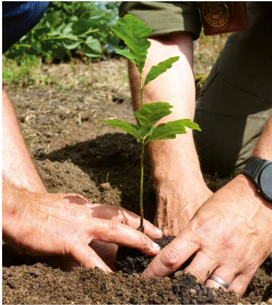
Ein „Beyus-Baby“ – Nachkomme der bekannten Beuys-Eichen.