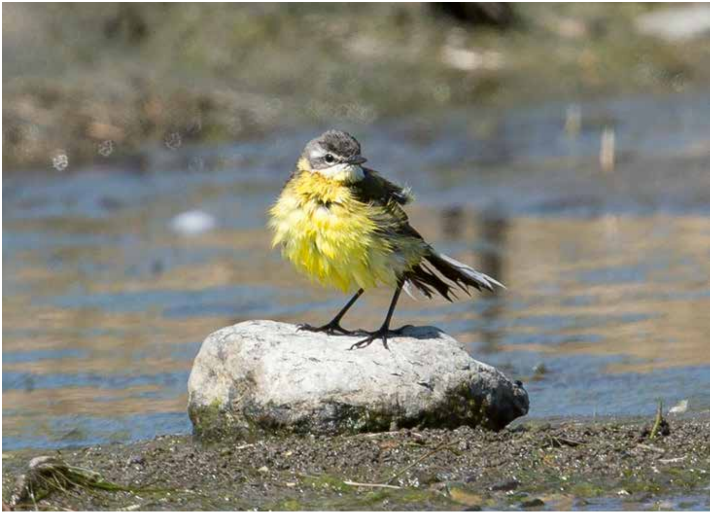
Schafstelze ( Motacilla flava )