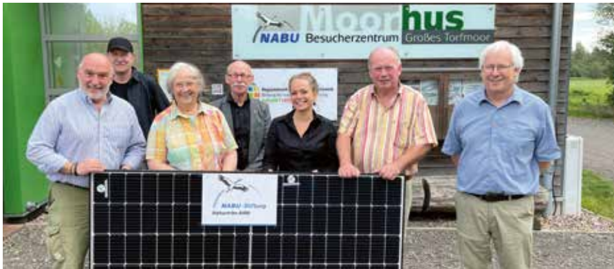
Einweihung der neuen Solaranlage auf dem Moorhus in Minden-Lübbecke mit Bärbel Höhn