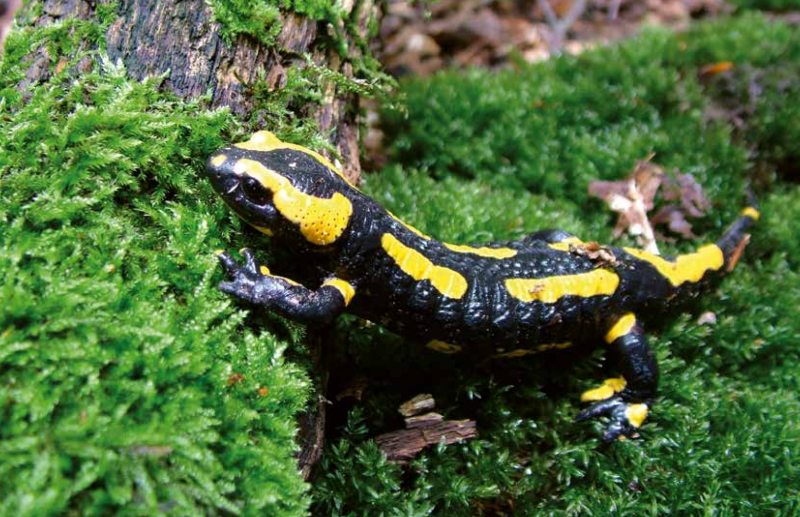
Feuersalamander (Salamandra salamandra)