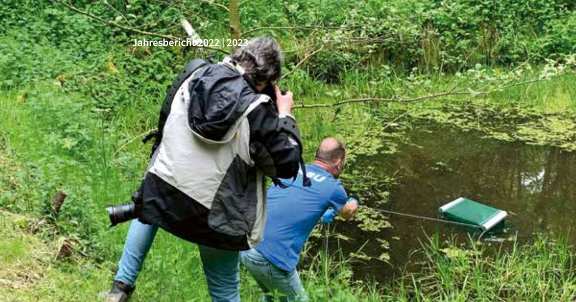
Teiche am Bünnbach