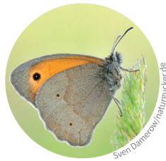
11. Großes Ochsenauge