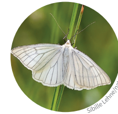
17. Weißer Schwarzaderspanner