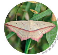
15. Ockergelber Blattspanner