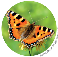
1. Kleiner Fuchs