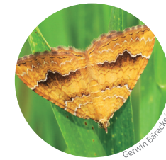
15. Ockergelber Blattspanner