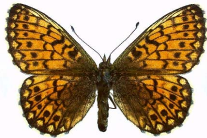
Boloria eunomia (w)

Abgesehen von der Tatsache, dass sich diese drei Arten schon recht gut durch die Art der Fleckung auf der Flügeloberseite unterscheiden, bieten die Unterseiten der Hinterflügel bei beiden Geschlechtern recht gute Unterscheidungsmöglichkeiten. Die meisten Silberfleckchen weist selene (a) auf. Bei euphrosyne (c) sind es deutlich weniger und eunomia (b) hat gar keine. Bei selene befindet sich im Wurzelbereich zudem ein sehr deutlicher runder, schwarzer Punkt (roter Pfeil), der auch auf der Flügeloberseite gut zu erkennen ist. Bei euphrosyne ist er viel kleiner und bei eunomia meist gar nicht erkennbar. Der Gesamteindruck der Hinterflügelfärbung erscheint bei eunomia gelb-grün, bei selene gelb-braun und bei euphrosyne auffallend rostrot.