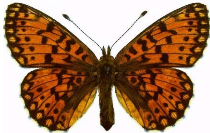
Boloria selene (w)