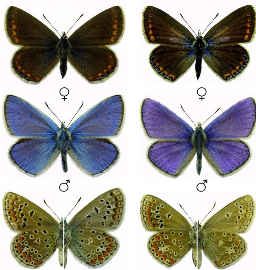
Unterseiten links weiblich, rechts männlich

Während Polyommatus icarus im ganzen Land vorkommt, sind von thersites nur wenige Einzelfunde im äußersten Südwesten von NRW bekannt. Beide Arten unterscheiden sich vor allem auf der Flügelunterseite. P. icarus besitzt zwei runde Fleckchen in der Nähe der Vorderflügel-Wurzel (roter Pfeil), die bei thersites stets fehlen. Sie fehlen bei icarus nur sehr selten (unter 1%). Dann hilft nur noch die Genitaldiagnose.